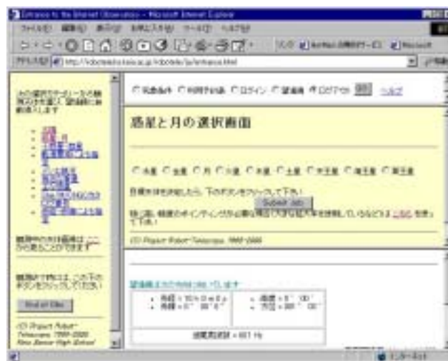
図 3：惑星を観測するときの操作画面

や望遠鏡が動く様子も映し出され、これだけでも楽しめる（前述したように、これが子供たちの教材に対する興味を大きく増す効果も期待される）。映像データの転送レートは、一般家庭から電話回線経由でインターネット接続する場合にも映像を受け取れるよう、25Kbps に抑えてある。天体の変化は通常ゆっくりなので、この程度の転送レートでもそれなりの画質を確保できる。将来的に ADSL のような高速回線が一般的となれば、より高い転送レートで高品質の映像を送ることができるようになる。