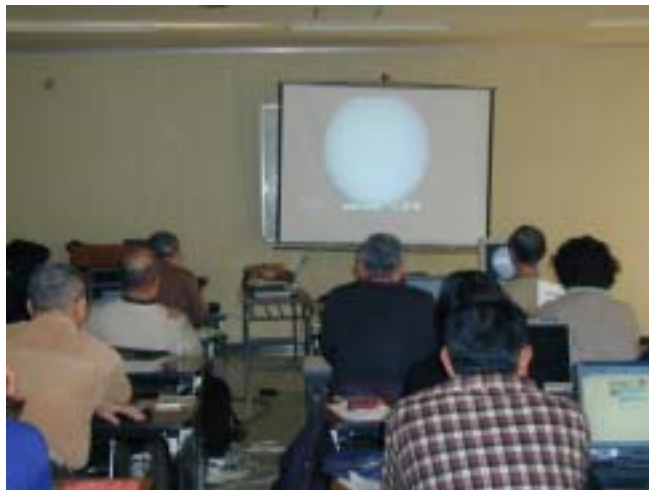
図1：柏市松葉公民館における中高年者対象の講習会で、インターネット天文台による観測を実演したときの様子