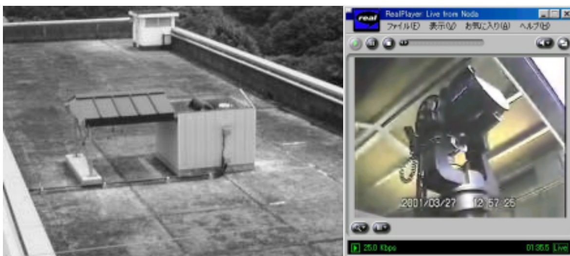
図 2：ルーフ開閉式観測室（左）と，望遠鏡（右：ルーフが開いてゆく様子を RealPlayer で観察している）

ここで少し，既設のインターネット天文台について，そのハードウェアとソフトウェアを概観しておこう．